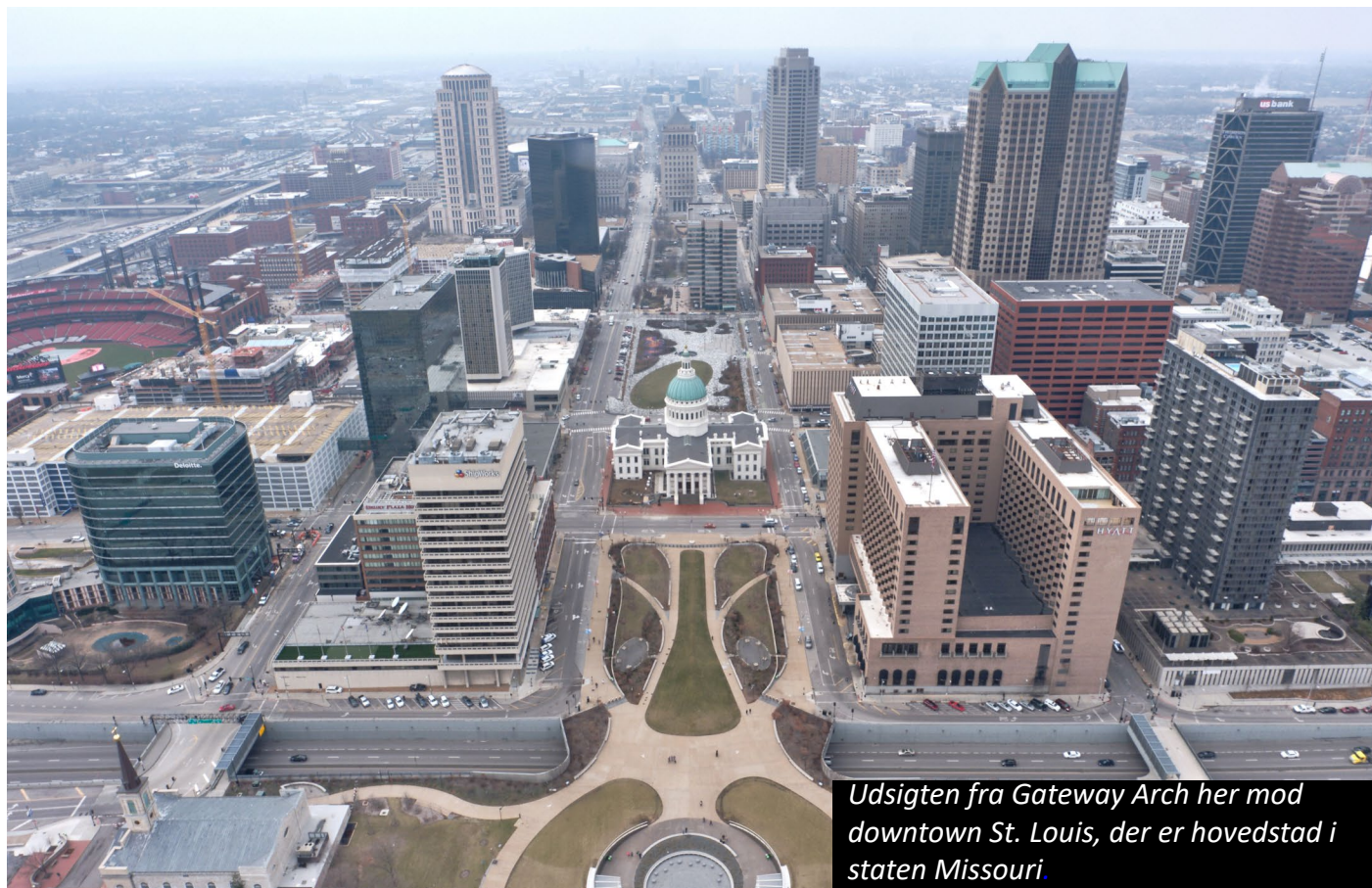
Udsigten fra Gateway Arch her mod downtown St. Louis, der er hovedstad i staten Missouri